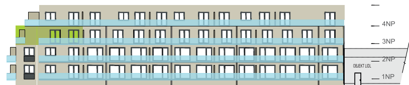
Západní pohled na dům / Building View - west side