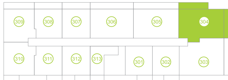
Půdorys podlaží / Floor plan